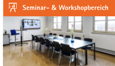
Seminar- & Workshopbereich